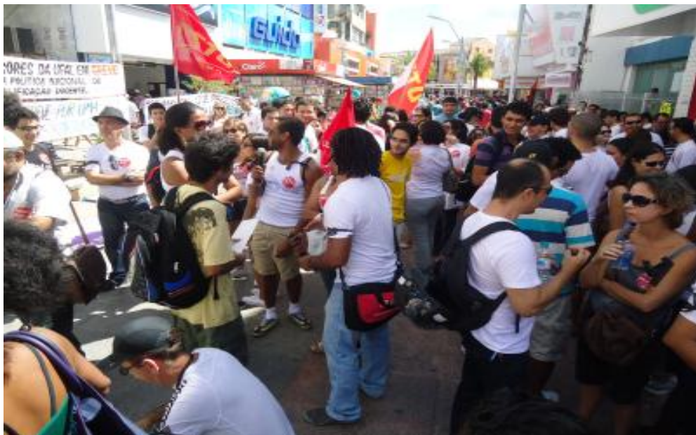
Figura 6- Manifestação de estudantes, professores e técnicos, concentrados em frente ao antigo Produban, na Rua do Comércio.