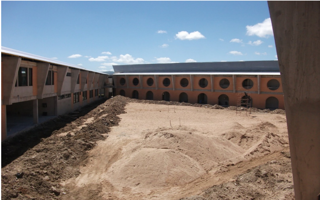
Figura 3 – Situação do campus na época da paralisação