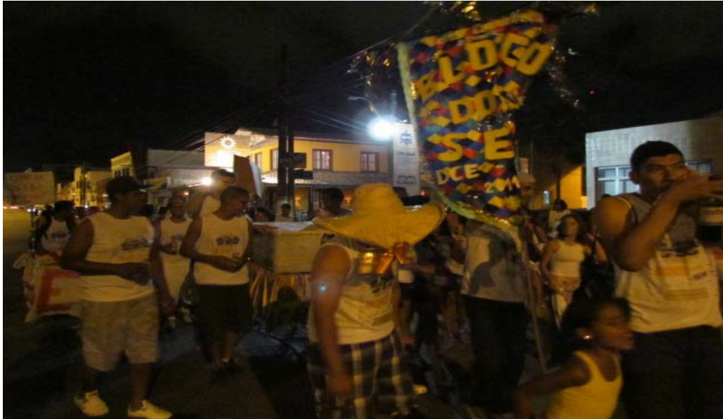
Figura8- Bloco dos SEM em seu primeiro ano no carnaval de 2011, no Jaraguá.