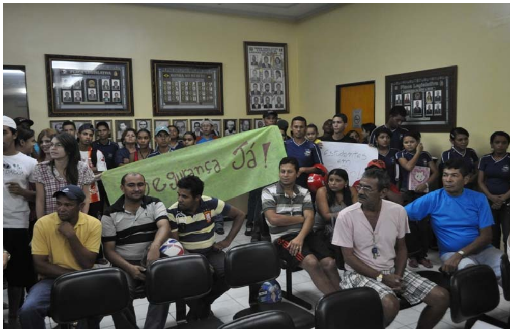
Figura 5- Manifestantes reunidos na Câmara de Veradores de Santana do Ipanema.