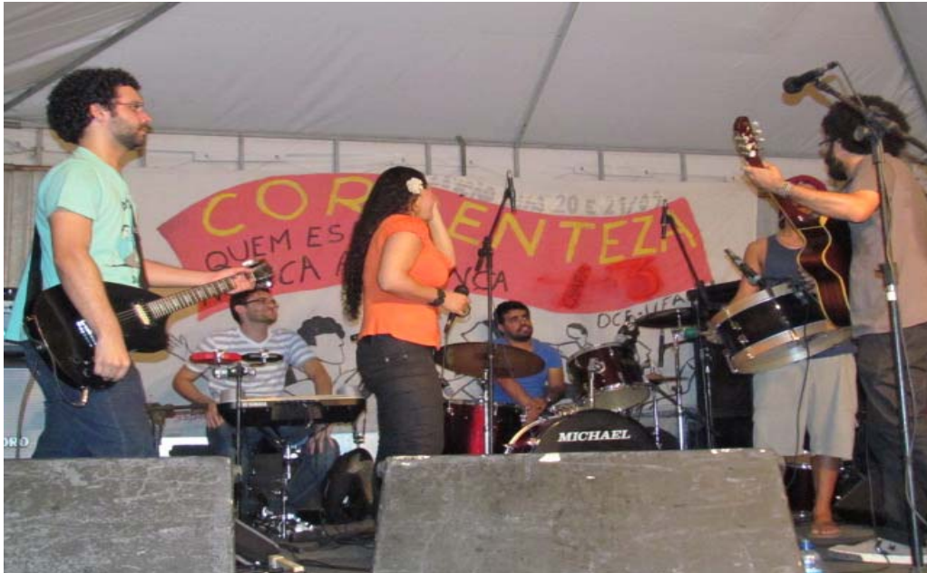
Figura7- Show da calourada UFAL 2012.1