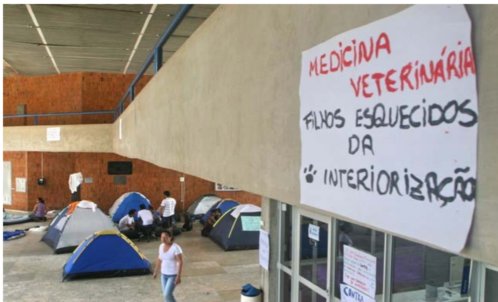
Figura 2- Ocupação da Reitoria no Campus Ufal por estudantes e professores de Viçosa.