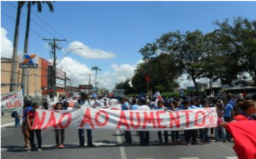
Figura 4- Protestos dos estudantes contra o aumento da tarifa de ônibus.