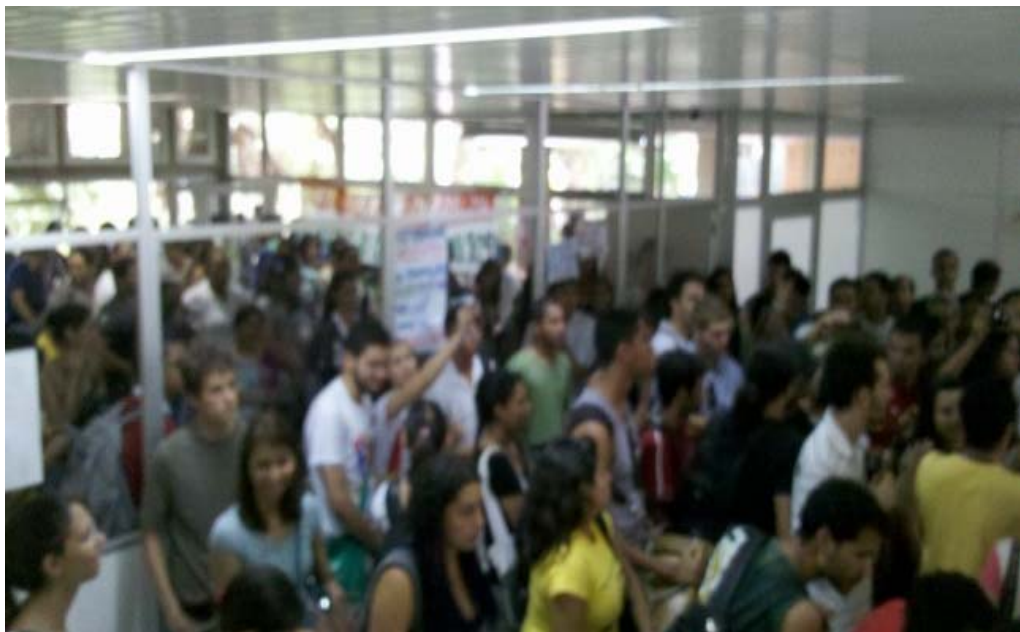
Figura1- Momento da entrada ao prédio da Reitoria pelos estudantes, após assembleia que decidiu pela ocupação.